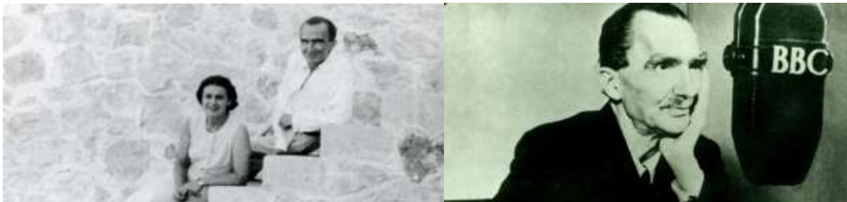
Публикации на русском языке